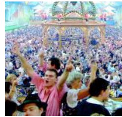
Europa, das sind wir, und wir sind demnach auch Oktoberfest.

Regisseur Nikolaus Geyrhalter stellt in seiner Dokumentation "Abendland" diese Fragen und noch viele mehr. Ohne je einen Off-Kommentar einzuspielen, ohne je die Bilder zu untertiteln, die sich in ihrer unscheinbaren Kraft aneinanderreihen. Bilder, die versuchen, die Mentalitäts-Essenz des sogenannten "Abendlandes" zu erfassen, gedanklich rekonstruierbar – oder erst ein wenig fassbar zu machen. Die Essenz des europäischen Kontinents, des politisch-wirtschaftlichen und sozialen Konstrukts dieser Festung, die sich abschottet, nach außen wie nach innen.